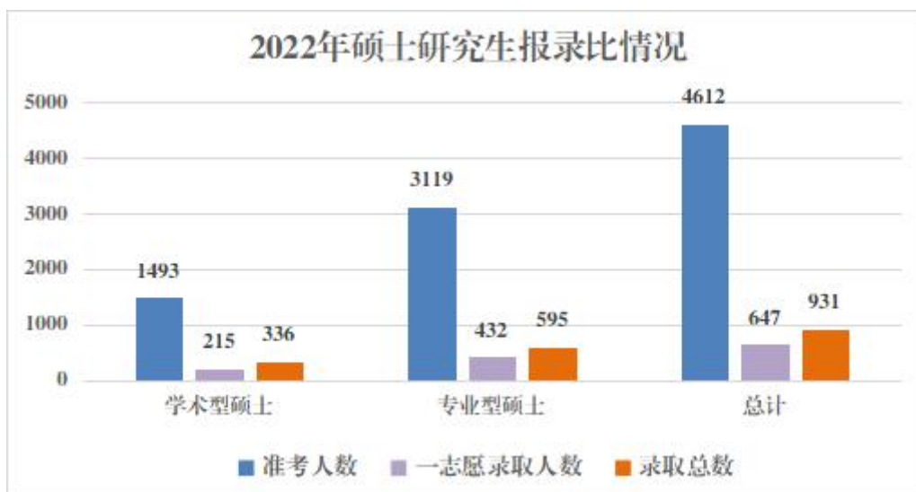
图2 2022年硕士研究生报录情况

3.2 录取情况。 2022年我校录取全日制硕士研究生931人，其中第一志愿647人，录取率由2021年的57%增长至69%，持续三年高增长，实现质的飞跃。学校坚持“按需招生，择优录取”的原则，通过自命题工作的周密部署、复试录取工作办法的严肃论证，采取网络远程复试的形式，经过严格筛选，足额落实招生计划，确保了硕士研究生招生考试的公开、公正、公平，并取得了研考零事故、考生零投诉的良好成绩。具体报录情况见图2。